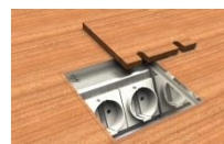
Serie 8802 / 3 / 4