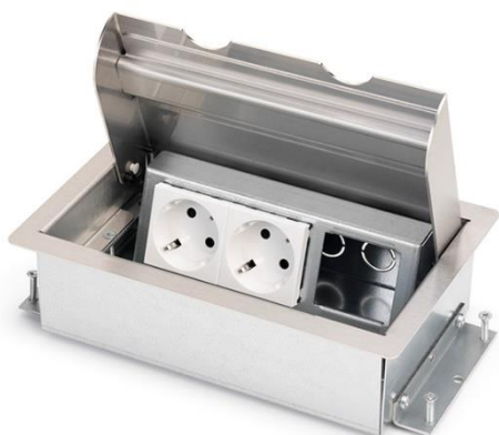
Servicebox@ 2.0 | 3-voudig