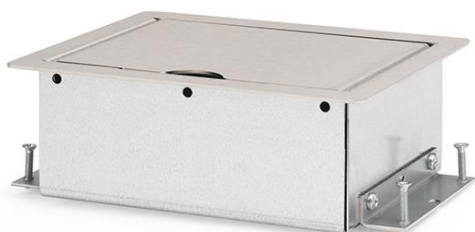
Servicebox@ 2.0 | 2-voudig | uitsparing t.b.v vast zetten in verhoogte/holle ruimte vloer.