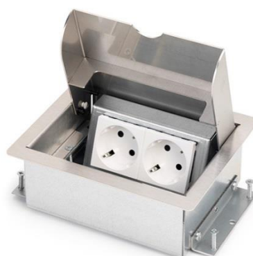
Servicebox@ 2.0 | 2-voudig