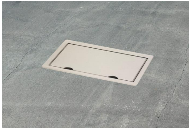
Servicebox@ 2.0 | 4-voudig