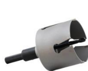
Gatenboor Ø 80 mm