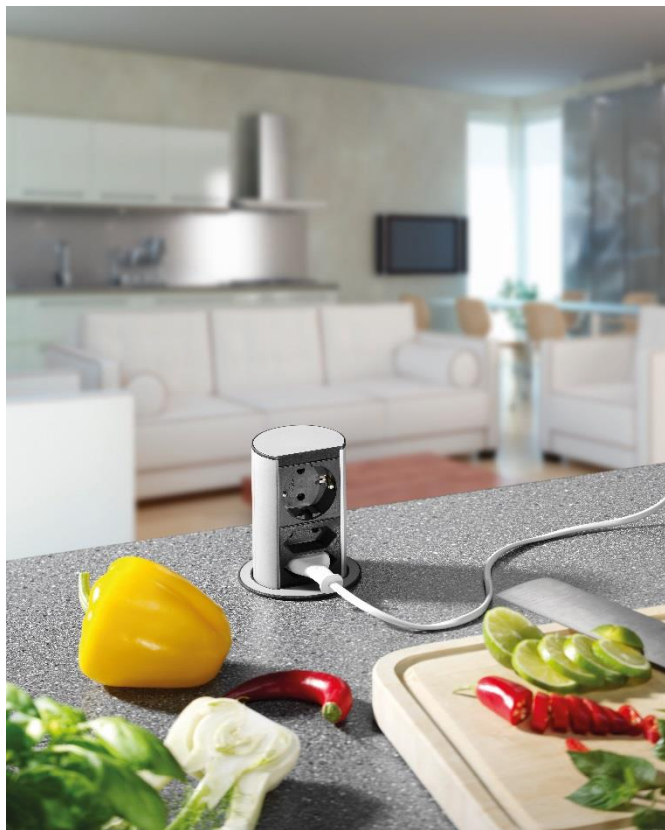
Elevator in keukenblad