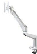
TFT arm Stockholm