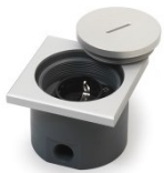
7601 instortvloer- doos voor buiten