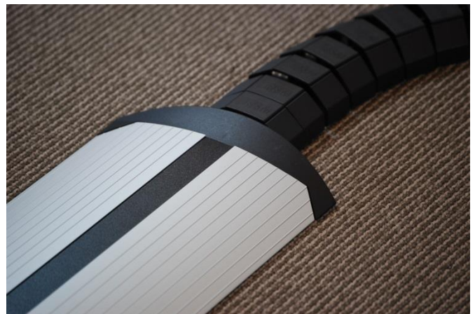
Eindstuk / overgang naar Flexkanaal