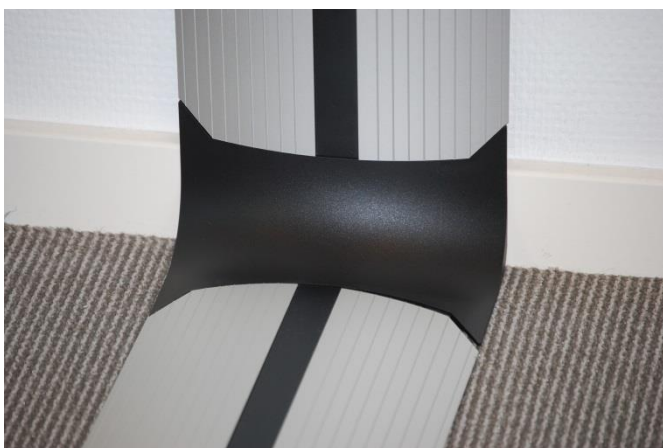
Verleng / kopelement / verticaal