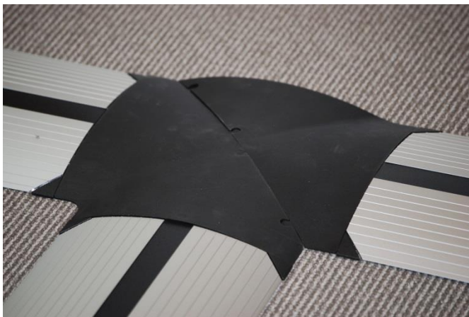
T-Stuk / splitter